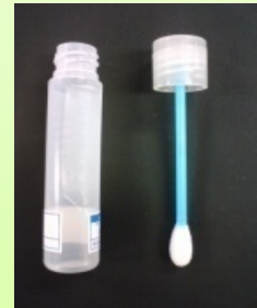
拭き取り用キット

ELISA法は定量検査です。 1~20 \mu g/gの範囲で定量値を ご報告します。