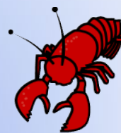
水産食品対象 25項目