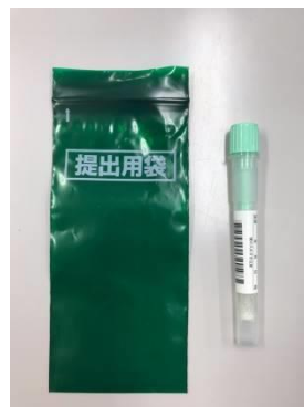
ノロウイルス検査容器